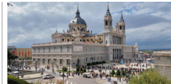
Almudena-Kathedrale in Madrid

In das Herz Spaniens – Madrid, Avila, Salamanca und Toledo – wird uns eine neuntägige, kulturell vielfältige Reise ab 3. Oktober führen. Madrid, die höchst gelegene Hauptstadt Europas, ist Ausgangspunkt. Neben einer Stadtrundfahrt besuchen wir u.a. den berühmten Prado und den Königspalast. In Avila lernen wir die Mystikerin Theresa von Avila näher kennen. Die sehenswerte Stadt Toledo präsentiert auf engem Raum Spaniens Kultur im Mittelalter und Vielfalt der Religionen. Natürlich fehlen auch Salamanca sowie berühmte Klosteranlagen in landschaftlicher Schönheit nicht im Programm. Die Reise wird vorgestellt