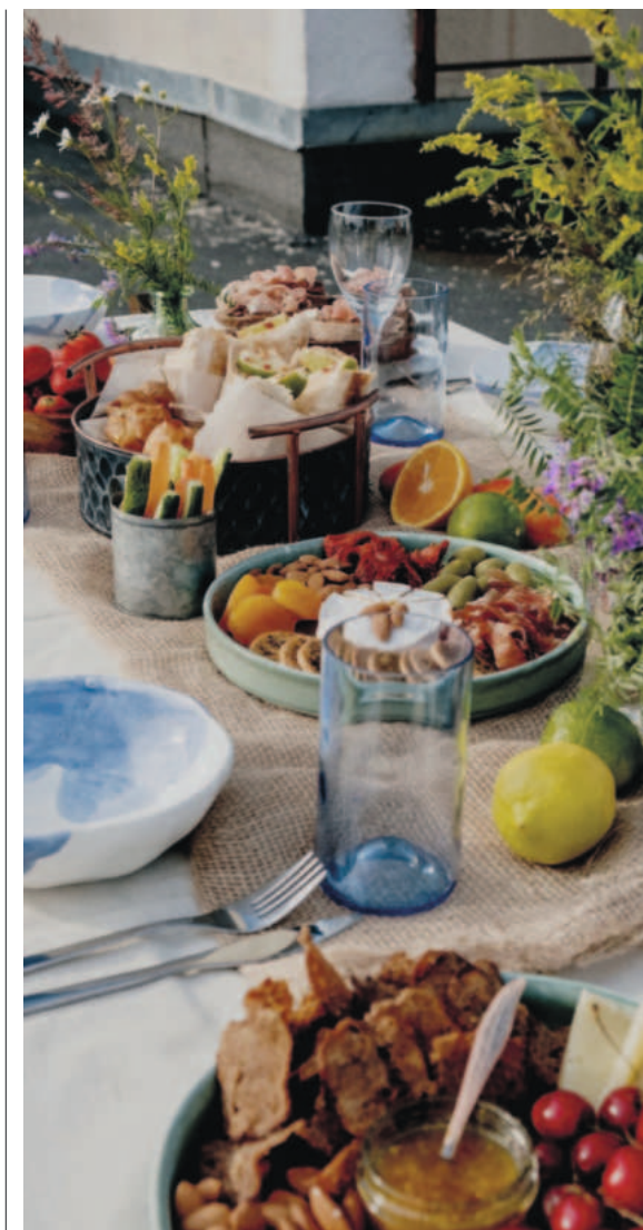
Ein wundervoll gedeckter Tisch